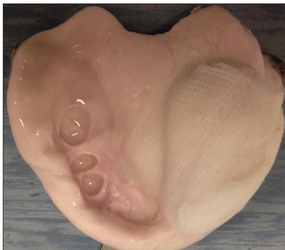
Ryc. 1. Wycisk anatomiczny pacjenta po resekcji lewej szczęki, pobrany masą alginatową.

Postępowanie kliniczne podczas wykonywania poresekcyjnych protez wewnątrzustnych wymaga zastosowania niestandardowych rozwiązań i może przysparzać trudności na każdym jego etapie nawet doświadczonemu lekarzowi. W przypadku ubytków tkanek w obrębie podniebienia, przed pobraniem górnego wycisku okolice otworu w podniebieniu zabezpiecza się wilgotną gazą lub istniejącą jamę wypełnia tamponami tak, aby uniemożliwić przedostawanie się masy wyciskowej do jamy nosowej, zatok, gardła lub krtani. 19,20 Materiałem wyciskowym jest masa alginatowa, zastosowana na łyżce standardowej (ryc. 1). W przypadkach, kiedy otwór jest niewielki a uzębienie zapewnia możliwość oparcia i zakotwiczenia na nim protezy, pobrany w ten sposób wycisk może służyć do wykonania modelu roboczego. 19 U pacjentów bezzębnych lub z uzębieniem resztkowym, z rozległym ubytkiem tkanek i dużym otworem w podniebieniu niezmiernie istotne jest wykonanie odpowiedniego wycisku czynnościowego na łyżce indywidualnej