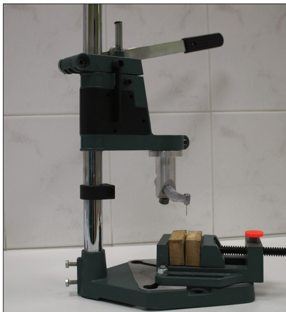
Ryc. 1. Urządzenie do powtarzalnego opracowania kanałów korzeniowych.

opracowano zgodnie z długą osią zęba, ustawiając wiertło pod kątem prostym do powierzchni nośnej korzenia. Dla spełnienia tych warunków wykonano specjalne urządzenie, które zapewniało możliwość jednoznacznego i powtarzalnego opracowania kanału korzenia zgodnie z jego długą osią (ryc. 1). Do opracowania kanałów korzeniowych użyto wiertel Peeso oraz wiertel z wybranego systemu, które montowano na końcówkę wolnoobrotową z chłodzeniem wodnym. Kanały zębów opracowano na 10 mm. Do opracowania kanałów pod cylindryczne wkłady metalowe zastosowano wiertła Parapost® Taper Lux™ Drill (Coltene/Whaledent Inc., Cuyahoga Falls, Stany Zjednoczone) o średnicy 1,25 mm pod wkłady metalowe.