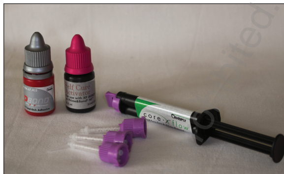
Ryc. 2. System wiążący V generacji XP Bond z aktywatorem do bondu Self Cure Activator (Dentsply Caulk, Milford, Stany Zjednoczone) oraz cement dualny CoreX Flow (Dentsply Caulk, Milford, Stany Zjednoczone).

Powierzchnie nośne i kanały opracowanych korzeni wytrawiano 37% kwasem ortofosforowym Scotchbond Universal Etchant (3M ESPE Dental Products, St. Paul, Stany Zjednoczone) w czasie 15 sekund, następnie obficie płukano i osuszono.